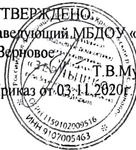
График влажной санитарной уборки помещений